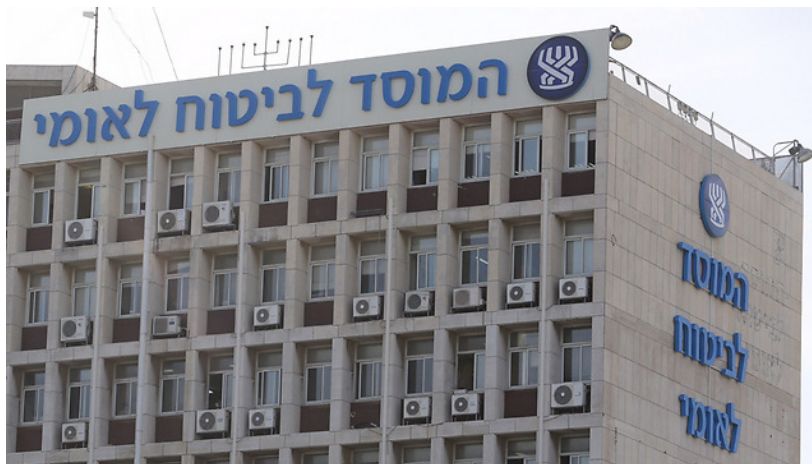
המוסד לביטוח לאומי. מתנגדים להצעה

הצעת החוק מבקשת להעלות את תעריפי הביטוח שמשלמים המעסיקים עבור תאונות עבודה, באמצעות שתי אפשרויות לבחירתם: או באמצעות תשלום אחיד נוסף למוסד לביטוח לאומי (כיום, המעסיקים מעבירים למוסד לביטוח לאומי פרמיה אחידה לכל עובד, ללא קשר למקצועו, בסך 1.96% מהשכר), או באמצעות פנייה לחברות ביטוח פרטיות ותשלום להן על פי פרמיה שידרוש המבטח לפי הערכת סיכון ענף העיסוק.