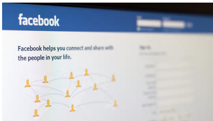
הרשת החברתית מציבה אתגרים חדשים בפני בתי הדין לעבודה

עו"ד דיסני מציין כי בית המשפט האזורי לעבודה בחן את מכלול הנסיבות, וקבע כי קיימים סממנים רבים המעידים על כך שחשבון הפייסבוק שייך ללרר, ובין היתר פורטו הנסיבות הבאות: